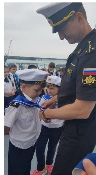
2022 г. Церемония посвящения в «Куниковцы»